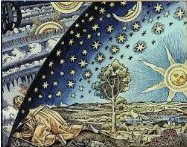
Der Alchemist, Holzschnitt, 16.Jhdt.

Die folgenden Tabellen verstehen sich sowohl als Einstiegshilfen, als auch als Vorschläge und Übungsbeispiele für alle an bio-energetischen Testverfahren interessierten Ärzte, Tierärzte, Therapeuten, Apotheker und Drogisten. Sie erheben keinen Anspruch auf Vollständigkeit.